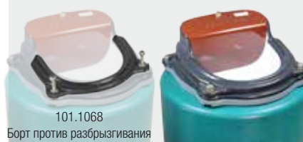
101.1068 Борт против разбрызгивания