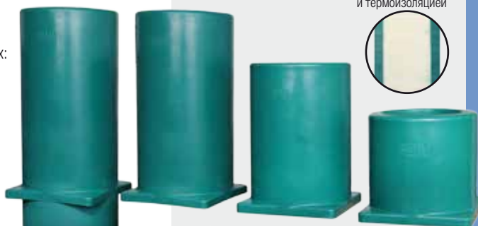
с двойными стенками и термоизоляцией